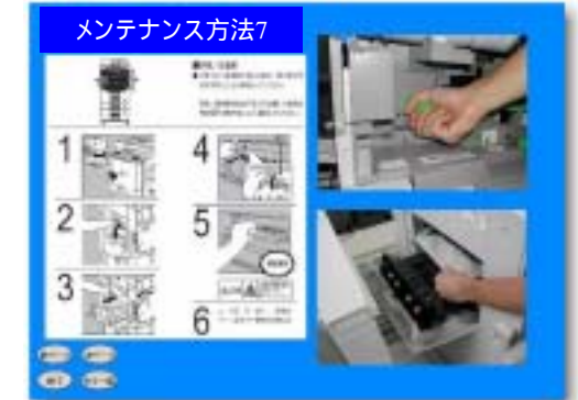
動画と音声による判りやすいマニュアルが作れます

操作や、手順が複雑な機器の説明に 取扱説明書のコストダウンを図りたい場合に 取扱説明書のホームページ掲載用に