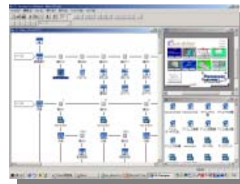
easy driver の編集画面例

easy driver は、画面上のアイコンをドラッグ&ドロップするだけで大部分の作業が行えますので、完成後の部分的な修正作業も、簡単にスピーディに行えます。また、言語の差し替えも、自動的に行えるので、工場や、サービス拠点の海外展開などにも容易に対応できるようになります。