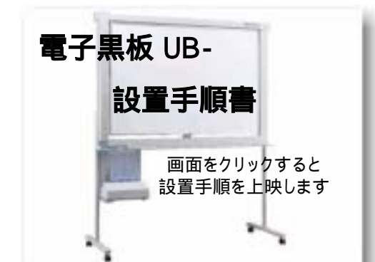
いつでもどこでも何度でも内容を確認できます

細かな設置や工事手順を分かりやすく、解説するツールとして 一斉に工事研修、設置が必要な全国の工事担当者への配布に